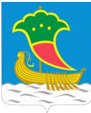
Схема теплоснабжения муниципального образования