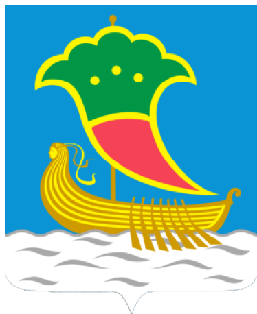
Схема теплоснабжения г.Набережные Челны на период до 2028 г. Обосновывающие материалы