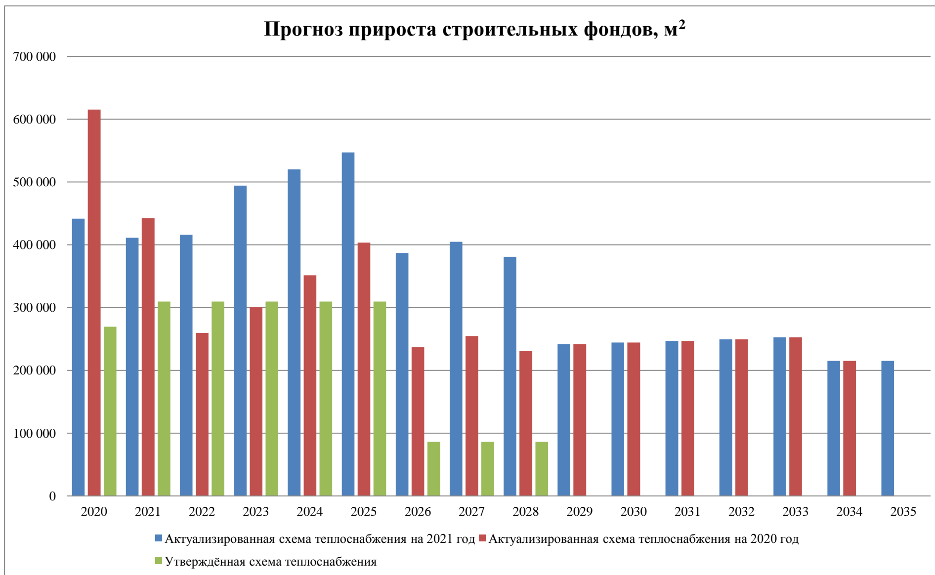
Рис. 9.1. Сравнение актуализированного прогноза прироста площадей строительных фондов относительно утвержденной и последней актуализированной схем теплоснабжения (кв.м.)